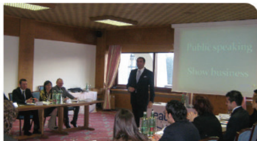
Reuniune de Zonă (Hotel Holiday Inn - Rimini)

Se diferențiază de reuniunile zonale, nefiind rezervate unei zone specifice, fiind întâlniri și confruntări la nivel național între responsabilii de agenții și titularii acestora.