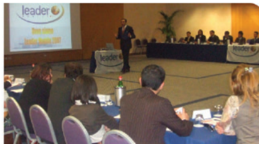
Meeting Național Afiliați (Hotel Hilton - Roma)