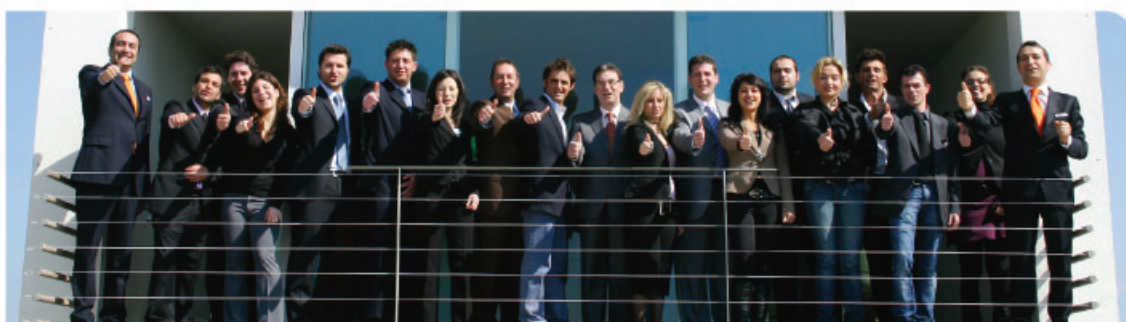
Participanții la Masterul "Descoperă Leader-ul ce se află în interiorul tău"

Este caracterizat prin aprofundarea următoarelor cunoștințe: Mobile Marketing , regulile sale și piața de referință; Mobile Solutions și platformele Leader de care vom beneficia; Procesul Comunicativ ; Training de vânzare ; Gestiune Financiară ...toate indispensabile în achiziționarea competențelor de specialitate ale mărcii Leader, din partea noilor afiliați.