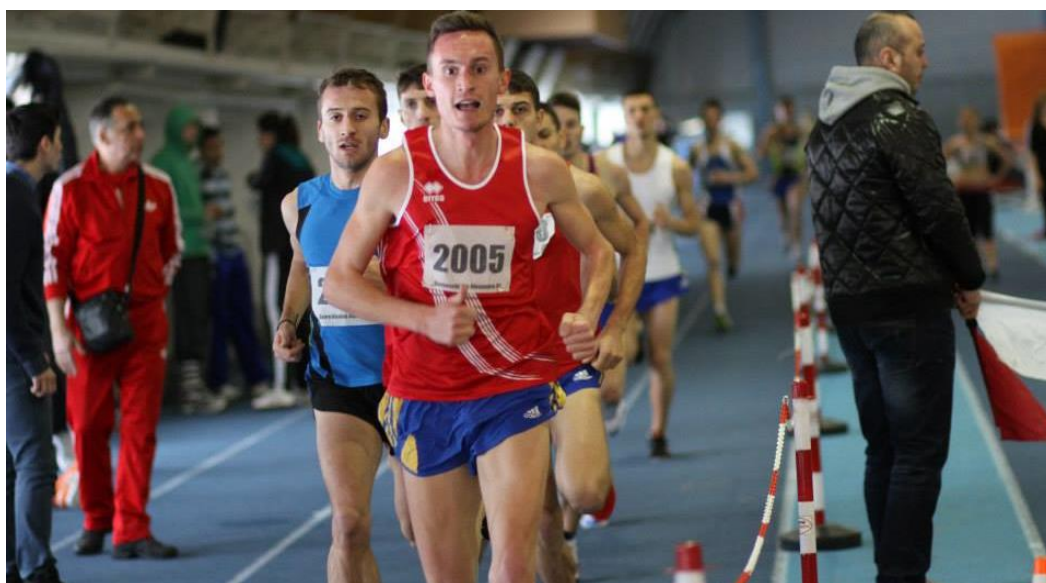
CAMPIONI NAȚIONALI UNIVERSITARI PENTRU UNIVERSITATEA "VASILE ALECSANDRI" DIN BACĂU